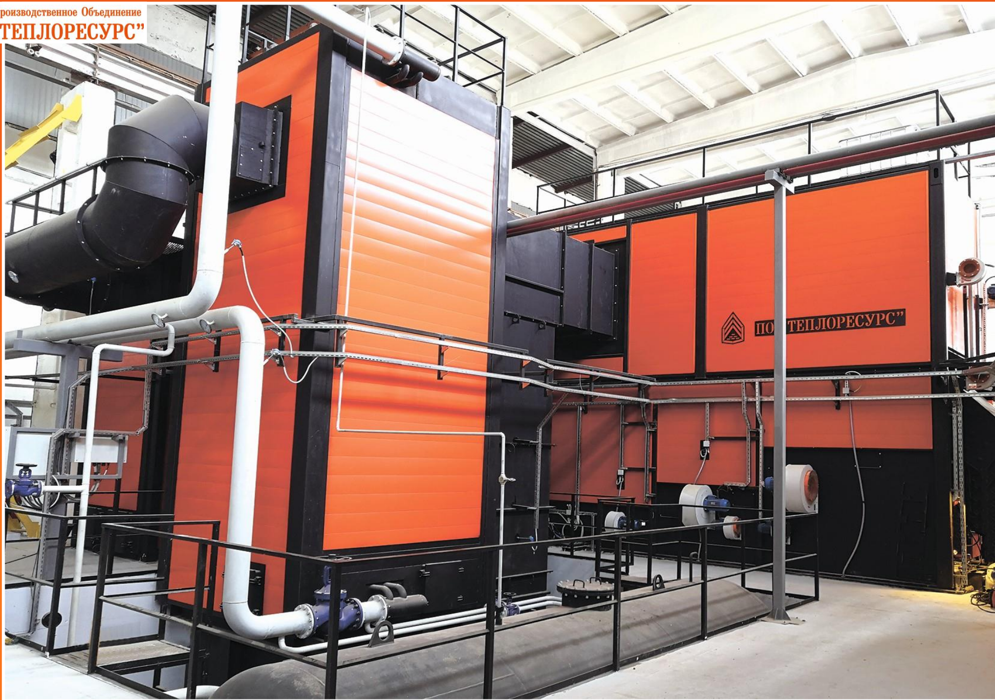
Термомасляная котельная 11 МВт Вологда Вологодский Лес