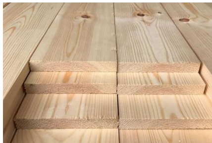
Сухие строганные пиломатериалы

ГОСТ 8486-86; Сорта: 1–3-й, 4-й; Породы: сосна; Длина: 3 и 4 м; Влажность: 16–18%.