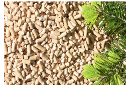
Древесные топливные гранулы

ГОСТ 26002-83; Сорта: 1–4-й, 5-й; Породы: сосна, лиственница, ЕПК; Длина: 4 – 6 м; Влажность: 18–20%