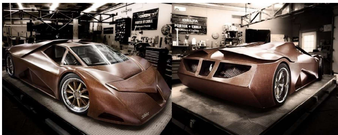
Рис. 6. Суперкар Splinter

Обучающиеся Государственного университета Северной Каролины (North Carolina State University) считают дерево лучшим материалом для создания автомобилей [2]. Разработанный проект деревянного суперкара Splinter – доказательство того, что дерево – лучший материал для создания автомобилей. Созданный суперкар намного мощнее и быстрее существующих суперкаров Lamborghini и Porsche. Древесина использовалась в разных частях автомобиля – в кузове, подвеске и даже центральной части колесных дисков. Предпочтение было отдано нескольким сортам древесины: маклюре оранжевой (самой прочной древесине Северной Америки), дубу, ореху и вишне. Из маклюры сделана подвеска, дубовый шпон пошел на колеса, из ореха – передняя часть кузова, а из вишни – задняя его часть (рис. 6).