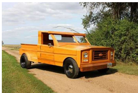
Рис. 9 – Деревянный Ford Pickup Truck

Житель одного небольшого городка Южной Дакоты автодизайнер Al Schoffulman изготовил деревянный Ford Pickup Truck из красного дуба (рис. 9).