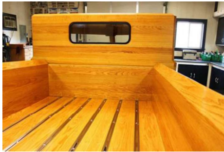
Рис. 16. Деревянный кузов автомобиля Ford Pickup Truck

Пол кузова полностью соответствует стилю американского пикапостроения (рис. 16).