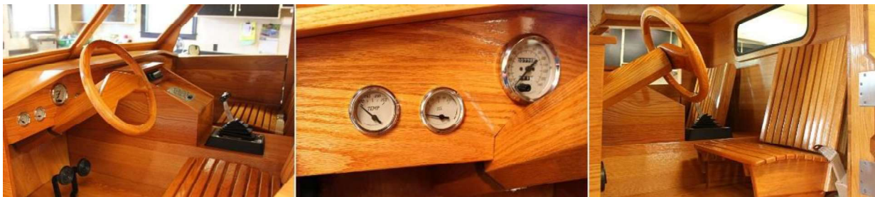
Рис. 12. Интерьер салона автомобиля Ford Pickup Truck

Большинство элементов изготовлены из древесины твердых пород, за исключением кузова, пола кабины и пожарной перегородки, выполненных из фанеры. Кресла автомобиля имеют специфическую форму и больше напоминают деревянные скамейки. Большие трудности при конструировании авто возникли с проектированием и изготовлением рулевой колонки и деревянного руля, облицованного красным дубом. Двери, изготовленные из дерева, крепятся обычным традиционным способом с использованием петель (рис. 13).