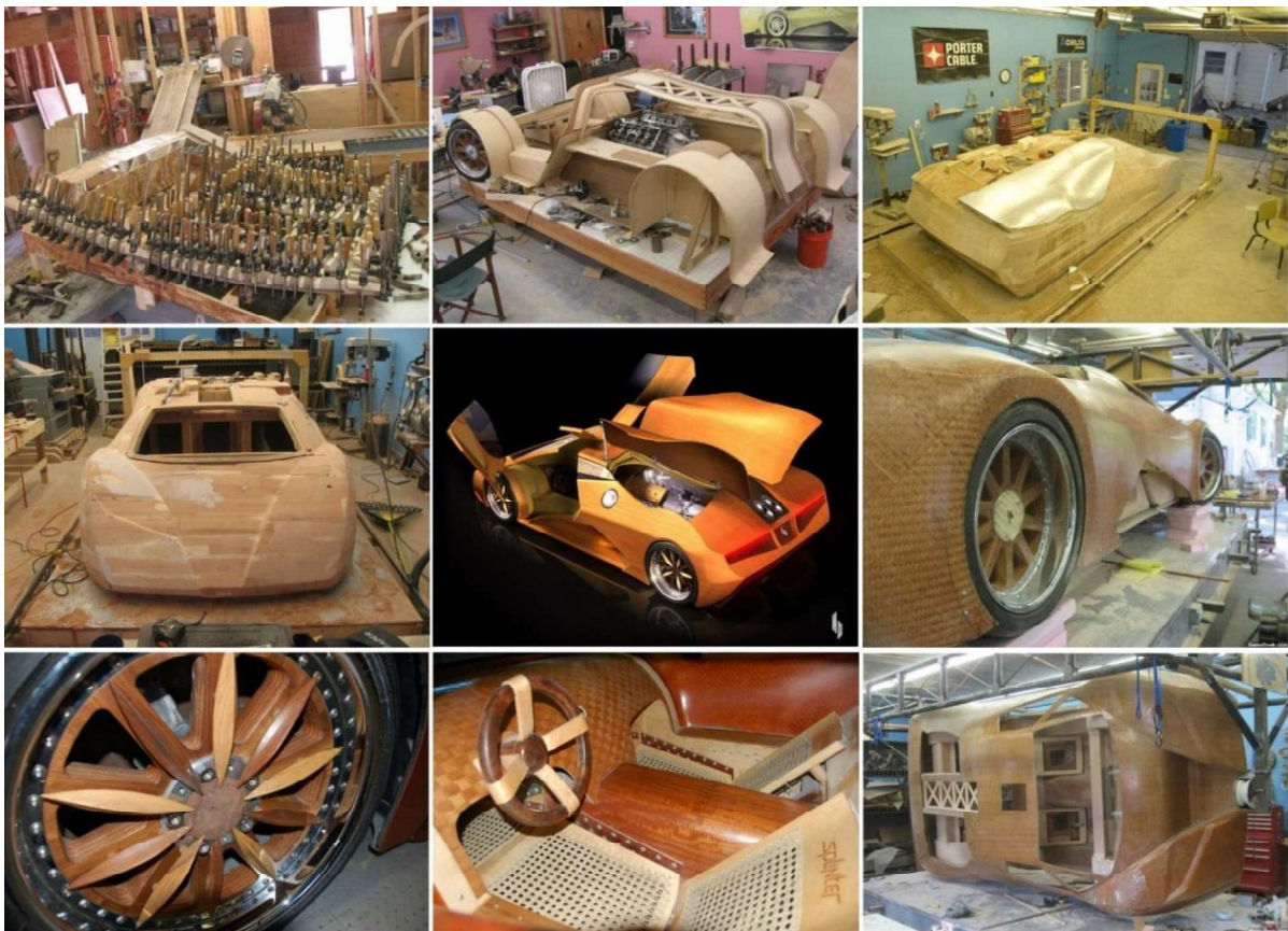
Рис. 8. Этапы работы по созданию суперкара Splinter

Данный двухместный суперкар намного легче современных суперкаров: его масса составляет 1 134 кг, автомобиль способен развивать скорость более 300 км/ч. На сегодняшний день данный суперкар существует в единственном экземпляре, так как главной целью разработчиков было – показать и доказать, что автомобиль возможно сделать из универсального природного материала – дерева, обладающего уникальными физико-механическими свойствами (рис. 8).