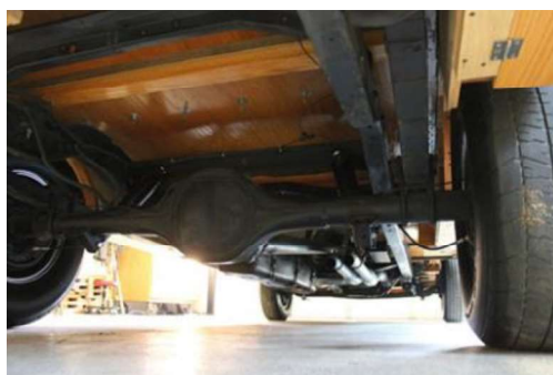
Рис. 10. Рама автомобиля Ford Pickup Truck

Свою работу по созданию деревянного джипа умелец начал с рамы 1979 Ford Econoline Van, двигателя и трёхступенчатой автоматической коробки передач (рис. 10).