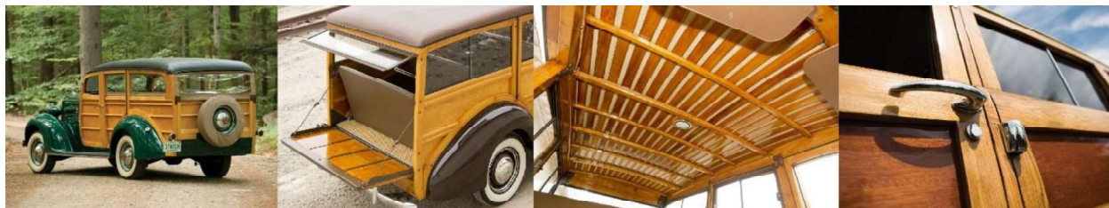
Рис. 3. Деревянные американские «Универсалы»

постепенно вытеснять деревянные конструкции, и лишь к 1950 г. после осознания непрактичности деревянных конструкций пришлось частично отказаться от дерева, как от дорогостоящего материала в обслуживании и ремонте. Полностью отказаться от использования древесины в изготовлении авто не смогли и перешли к выпуску автомобилей с внешними деревянными панелями и к автомобилям, замаскированным под деревянные (рис. 3).