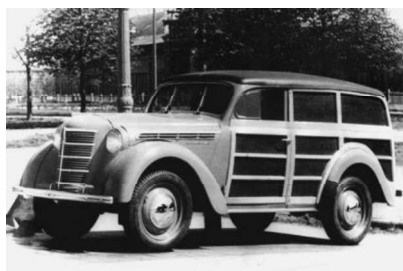
Рис. 4. «Москвич-400-422» «Буратино», производитель СССР

В 1948 году московские конструкторы СССР, чтобы сэкономить стальной прокат, выпускают небольшой серией фургончик с деревянным кузовом «Москвич-400-422» «Буратино» грузоподъемностью 200 кг (рис. 4).