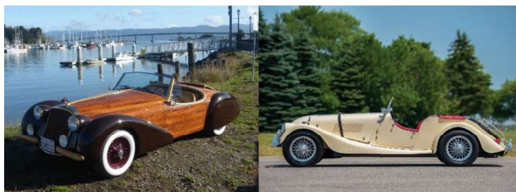
Рис. 5. Автомобиль из дерева «Морган» (Англия)

Изготовление деревянных каркасов очень трудоемкое дело. Мастера-кароццери создают настоящие автомобильные шедевры. Прекрасные формы могут сделать только настоящие художники и профессионалы своего дела. Каждый брусок каркаса имеет криволинейную форму, которую можно достичь только путем предварительного распаривания и размачивания древесины и последующего сгибания ее в нужную заготовку. При выборе заготовок следует обращать внимание на естественный изгиб волокон, а во время работы – стараться сохранять их направление. Дерево, как и любое природное сырье, может деформироваться, начать гнить и разлагаться. Этому способствуют неблагоприятные, порой даже агрессивные факторы внешней среды, воздействие разного рода бактерий, плесени и насекомых вредителей. Для избавления от таких проблем необходимо заранее позаботиться о древесине и обработать ее эффективным антисептическим средством.