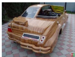
Рис. 1. Автомобиль из дерева «Химера»; дизайнер В. Лазаренко

Дерево и автомобиль – на первый взгляд может показаться, что это два абсолютно не совместимых понятия. Бытует мнение, что древесине нет места в автомобилестроении, так как она хорошо горит. Но авто-дизайнеры совершенно другого мнения и любят применять дерево для интерьерной отделки салонов автомобилей премиум класса, используя различные вставки из ценных или экзотических пород древесины. За счет отделки салона любое транспортное средство можно сделать современным, оригинальным и креативным. Как ни странно, древесина отлично подходит не только для декорирования интерьеров и строительства домов, но и вполне возможно ее использовать для создания настоящих машин, получая элитные деревянные автомобили (рис. 1).