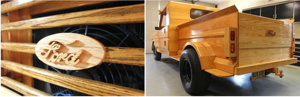
Рис. 15. Деревянная эмблема Форда на автомобиле Ford Pickup Truck

Пол кузова полностью соответствует стилю американского пикапостроения (рис. 16).