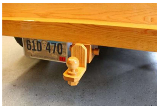
Рис. 14. Фаркоп автомобиля Ford Pickup Truck

Деревянный шаровой фаркоп – самый уникальный и эстетический элемент автомобиля, способный выдержать не очень большую нагрузку (рис. 14).