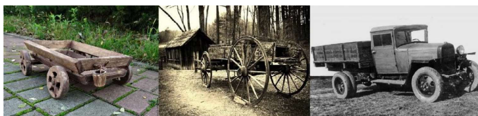
Рис. 2. Первая деревянная техника

Используя физико-механические характеристики древесины (прочность, износостойкость, теплопроводность, привлекательный внешний вид и т. д.), её используют для возведения инженерных сооружений различной сложности, а также для изделий различного назначения (мебели, бытовой утвари, игрушек и т. д.). Использовали этот природный материал с давних времен – это и первые деревянные колеса, и телеги, а с появлением первых грузовых автомобилей дерево прочно вошло в автомобилестроение в качестве основного материала при конструировании кузова (рис. 2).