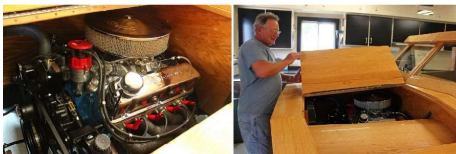
Рис. 11. Двигатель Ford Pickup Truck

Мастеру пришлось сместить вперед двигатель, передвинуть ближе к осевой линии коробку передач, укоротить раму для сохранения пропорций авто. Установить новые головки цилиндров и вычистить до блеска 150 000-мильный двигатель (рис. 11).