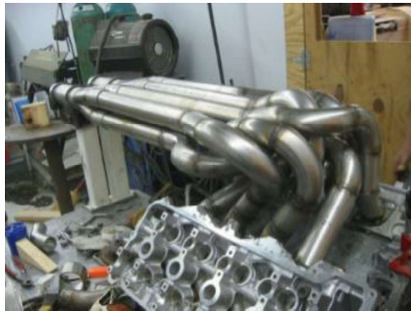
Рис. 7. Двигатель Cadillac V8 суперкара Splinter

механической коробкой передач (от Chevrolet Corvette C5) и дифференциалом повышенного трения Getrag. Во избежание риска самовозгорания автомобиля была изменена конфигурация выхлопных труб (рис. 7).