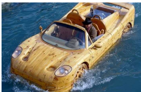
Рис. 18. Автомобиль-амфибия Ferrari F50

В настоящее время древесина считается ценным материалом для отделки и дизайна интерьеров салонов различных автомобилей, относящихся к классу люкс [3]. И, возможно, в сфере автомобилестроения произойдет возврат к прошлому, и на дорогах современных мегаполисов снова появятся автомобили, сделанные из древесины, и они будут считаться самыми крутыми и стильными.