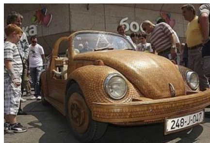
Рис. 17. Дубовый чешуйчатый Volkswagen Beetle

Al Schoffulman – истинный творец и большой любитель автомобилей, имеющий много интересных задумок по дальнейшему усовершенствованию своего деревянного любимца – джипа Ford Pickup Truck. Многие настоящие умельцы и мастера больше любят и ценят сам процесс работы чем ее результат. Босниец Момир Божич (Mimir Bozhich) создал свою версию Volkswagen Beetle – дубовый чешуйчатый «Жук» с максимальным использованием деталей из дерева, который является полной копией оригинального автомобиля (масштаб 1:1) (рис. 17).